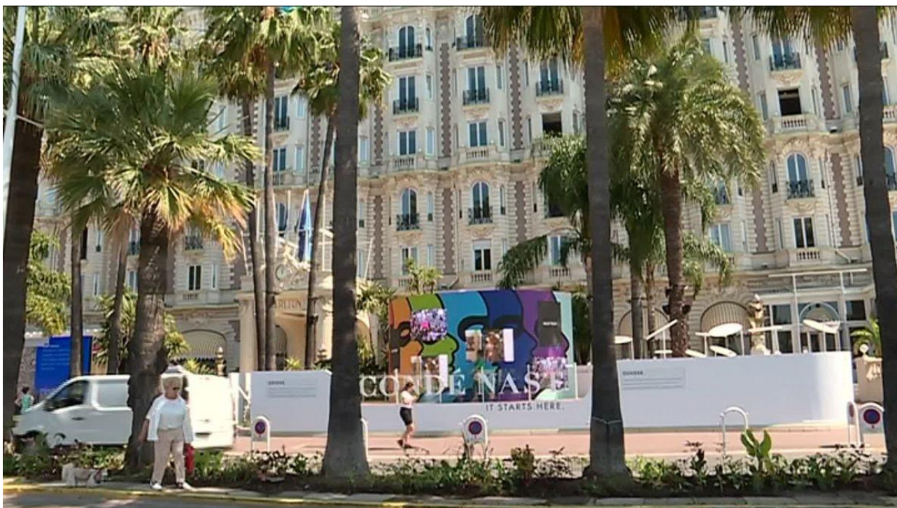
Des panneaux publicitaires très nombreux à Cannes

Des panneaux publicitaires comme s'il en pleuvait, plus moyen d'y échapper. À Cannes, ces affiches fleurissent un peu partout, même sur les façades d'hôtels classés historiques comme le Carlton.