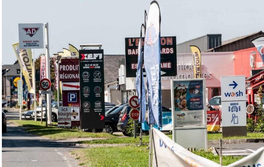
L'entrée de ville de Honfleur constellée d'enseignes de pub - Paysages de France

Ces prix sont accompagnés de distinctions personnalisées. Carnac obtient le « prix Obélix 2.0 » à cause d'un alignement de plots en plastique de circulation devant les célèbres alignements de menhirs. La place des Vosges de Paris est aussi pointée du doigt ironiquement pour sa « mise en valeur du patrimoine », une grande bache publicitaire placardée sur un monument.