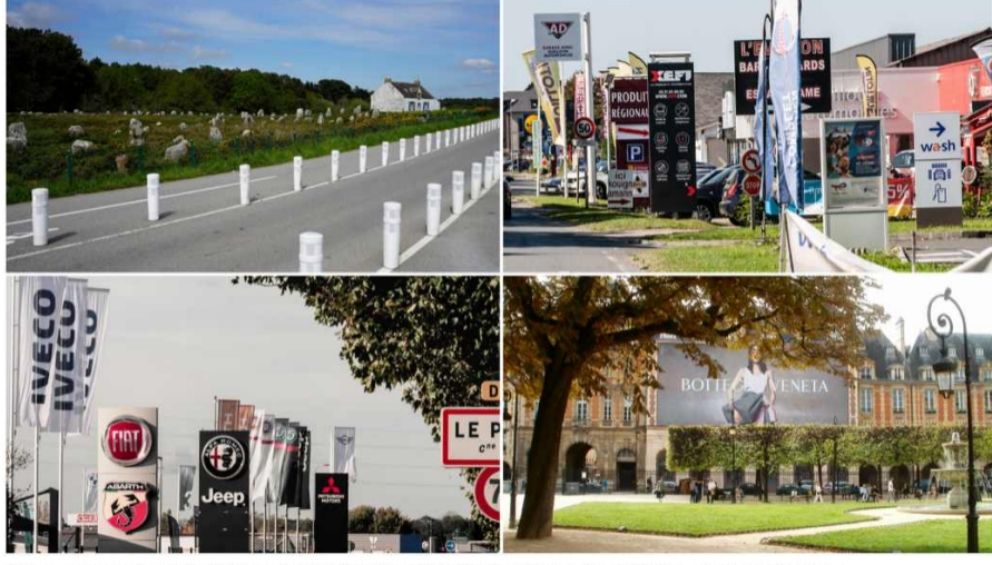
Carnac, Honfleur, Chavelot et Paris ont reçu le titre des quatre villes les plus moches de France - Paysages de France

L'association Paysages de France a publié son quatuor annuel des villes les plus moches de France. Pollution visuelle, enseignes et pancartes publicitaires sont les clés de ce classement peu glorieux.