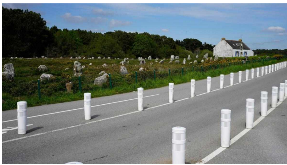
L'alignement de plots en plastique près des menhirs de Carnac

Chaque année, cette association, qui entend « mettre en avant des atteintes à nos paysages », publie un classement des quatre endroits les plus moches de France. Les malheureux élus de cette année sont Carnac dans le Morbihan, Chavelot dans les Vosges, Honfleur dans le Calvados et Paris.