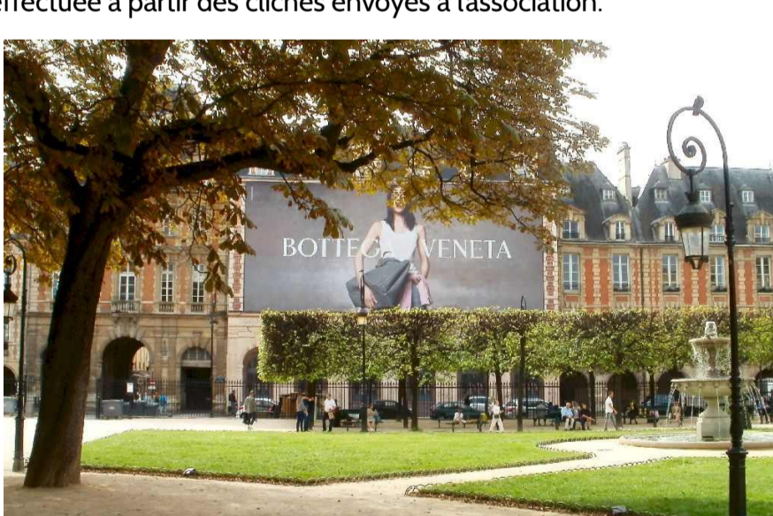
La place des Vosges surplombée d'une bache publicitaire - Paysages de France

Chavelot décroche de son côté la catégorie « tripotée d'enseignes et sans concession » dans sa zone commerciale du Pré-Droué. Dans le même genre, « l'entrée de ville de Honfleur » est critiquée pour une densité impressionnante d'enseignes en tout genre. La sélection est effectuée à partir des clichés envoyés à l'association.