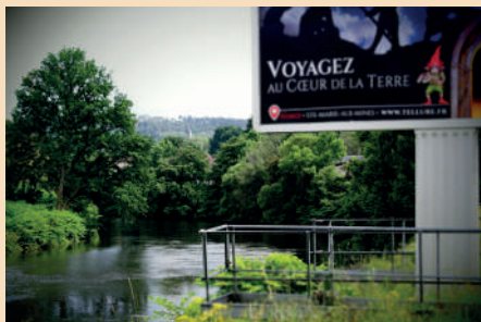
“Quand reverrai-je, hélas, de mon petit village, fumer la cheminée ?” (Joachim du Bellay.)

Les meilleures photos pourront faire l'objet d'une exposition, de tirages papier et d'une diffusion sur notre site internet.