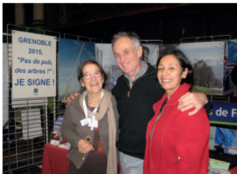
Denis Cheissoux, de France-Inter, devant le stand de Paysages de France. Son émission « CO 2 mon amour » était diffusée ce jour-là en direct depuis Grenoble.

les 11 et 12 mars 2017, le débat ait été aussi riche et enthousiaste entre le public, très nombreux, et les adhérents de Paysages de France installés pour deux jours au cœur même du dispositif de la Biennale, dans le cadre prestigieux de l'ancien musée-bibliothèque de Grenoble.