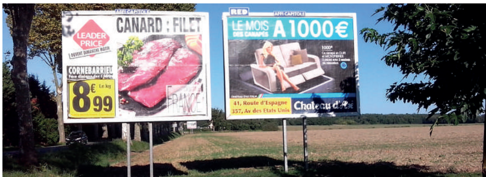
Ô Toulouse ! Ce que les afficheurs font lorsqu'on les laisse faire.

De nombreux projets de règlements de publicité sont actuellement en chantier : renseignez-vous pour savoir ce qu'il en est dans votre secteur. Si un projet est annoncé ou est en cours, informez au plus vite le siège de Paysages de France en appelant le 06 82 76 55 84 : les interventions de notre association peuvent être décisives comme cela a déjà été le cas dans nombre de communes, dont Paris et, bien sûr, Grenoble.