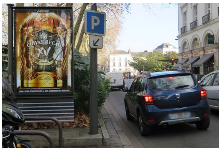
Exemple boulevard Heurteloup :

Or la ville de Tours, comme beaucoup de communes de France, laisse l'afficheur installer la publicité sur la face la plus visible, dans le sens principal de circulation, l'information municipale au dos étant le plus souvent peu ou pas visible. Un comble !