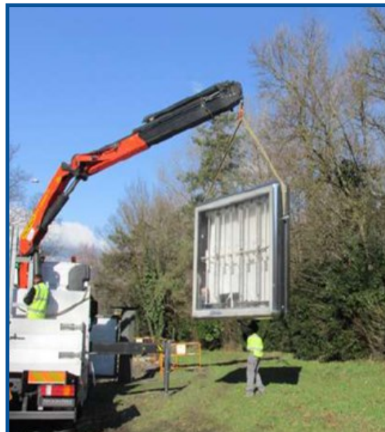
Grenoble : libération de l'espace public par JCDecaux en février 2015

Le manque à gagner pour les caisses municipales, souvent évoqué, a été « très largement compensé par les économies déjà réalisées sur le budget protocole » selon la mairie.